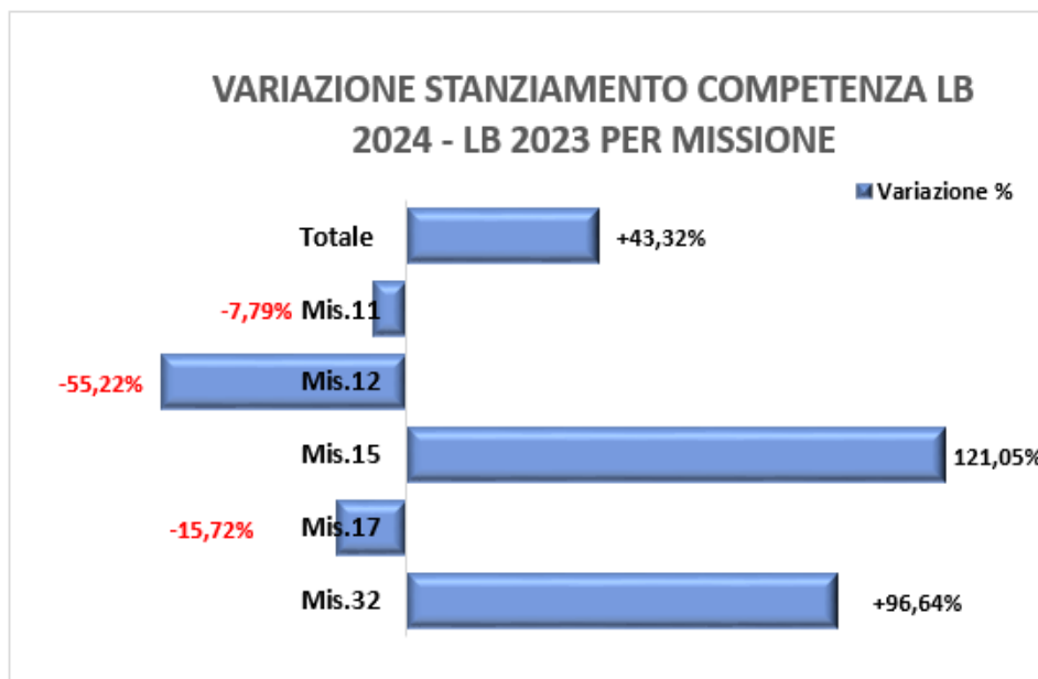
FIGURA 4 –VARIAZIONE STANZIAMENTO MISSIONE RISPETTO ALL’ANNO PRECEDENTE

FONTE: Legge di Bilancio 204 e Legge di Bilancio 2023(stanziamenti di competenza)