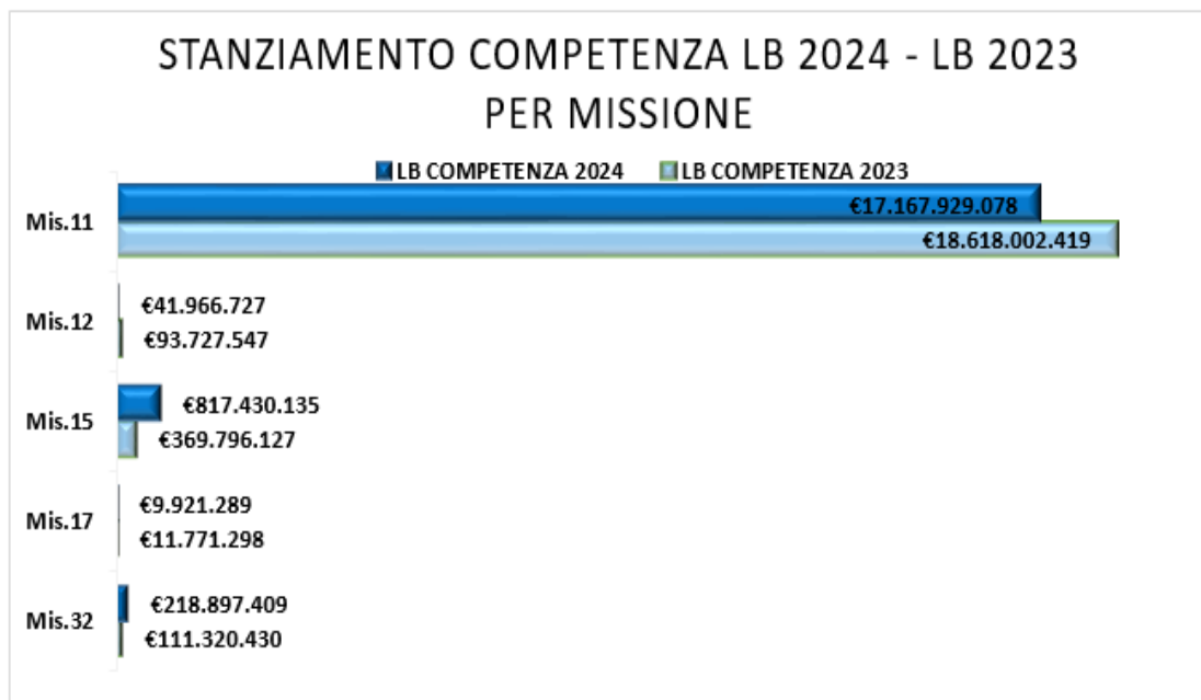
FIGURA 3 – IMPORTI STANZIAMENTO LB 2024 – LB 2023